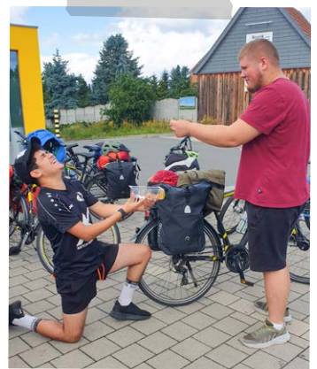
Off ging es sehr fröhlich zu!