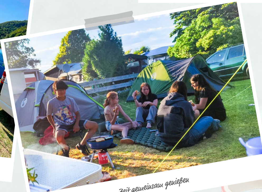
Zeit gemeinsam genießen