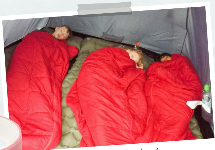
Tagsüber auf dem Fahrrad, nachts gemütlich im Schlafsack