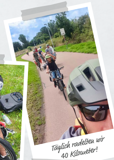
Täglich radelten wir 40 Kilometer!

Ein besonderer Dank gilt auch dem AWO Kreisverband, der uns bei unseren Touren materiell unterstützt und solche Erlebnisse mit möglich macht.