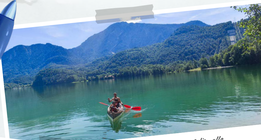
Wasserspaß für alle

Die Abende verbrachten wir in geselliger Runde. Beim Grillen, Kartenspielen und in gemeinsamen Reflexionsrunden ließen wir die Tage ausklingen. Jeder konnte seine persönlichen Highlights teilen, wodurch ein starkes Gemeinschaftsgefühl entstand. Die Woche am Kochelsee war geprägt von intensiven Erlebnissen, neuen Erfahrungen und wertvollen Begegnungen. Wir kehrten zurück mit vielen schönen Erinnerungen und dem Gefühl, etwas Besonderes erlebt zu haben.