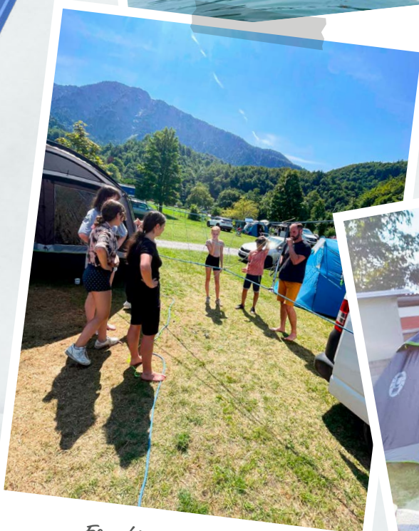
Es geht nur gemeinsam!