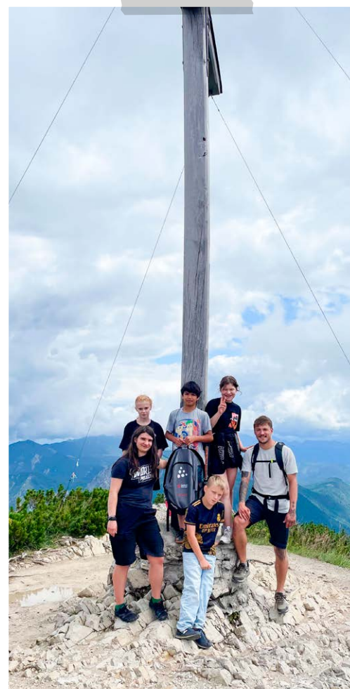
Die Anstrengungen haben sich gelohnt!