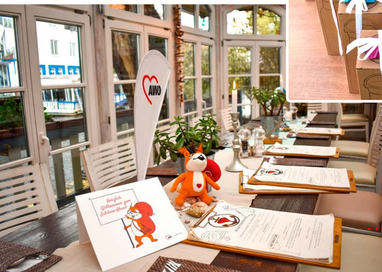
Jubilare-Abend im Heimathafen, Leipzig 2025