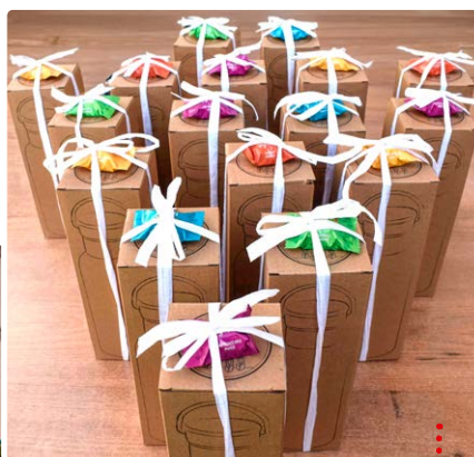
Geschenke für die Ehrenamtler:innen

Im vergangenen Jahr haben wir aufgrund unseres 35-jährigen Jubiläums ein großes Mitarbeiterfest veranstaltet. Dies werden wir in größeren Abständen wiederholen. Dieses Jahr soll es eine gemeinsame Weihnachtsfeier für alle Einrichtungen geben. Wir hoffen auch bei diesem auf große Resonanz und ein schönes Miteinander zum Ende des Jahres.