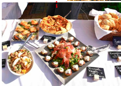
Französische Genüsse beim Ehrenamtsfest im vergangenen Jahr

Ebenso besonders sind die »Jubilare-Abende«. In gemütlicher Runde und bei einem genussvollen Abendessen werden langjährige Mitarbeitende geehrt. Diese Abende stehen ganz im Zeichen von Wertschätzung und Dankbarkeit – persönlich und herzlich.